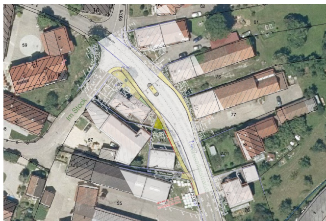
Verlegung der Bushaltestelle und Errichtung einer Querungshilfe für Fußgänger

Die Maßnahme dient wegen der Verbesserung der Verkehrsverhältnisse, der Beseitigung von Unebenheiten, der Abdichtung der Kanäle und der Erneuerung der Wasserversorgung nicht nur der Umwelt, sondern auch Ihnen als Bürger von Oppertshofen.