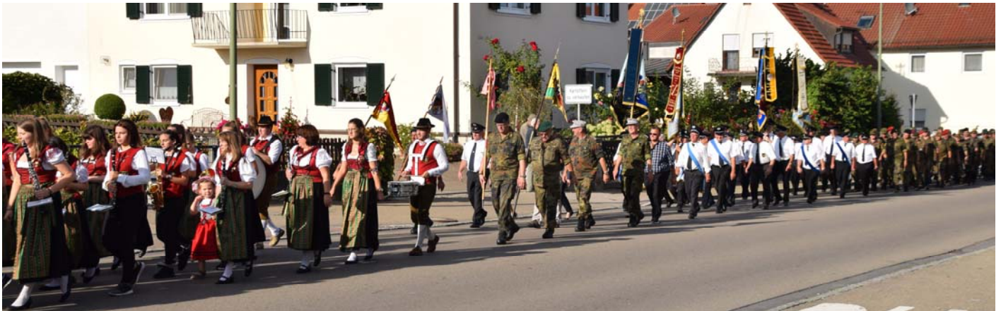
Zug zum Rathaus unter Begleitung der VMT Tapfheim und der Fahnenabordnungen der Soldaten- und Kameradenvereine

Herzliches Dankeschön an die Unterstützung der örtlichen Kameradenvereine, der Vereinigten Musikkapelle Tapfheim und der Freiwilligen Feuerwehr Donaumünster/Erlingshofen für die Streckensicherung.