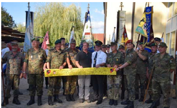
Gelbes Band wird einer aktiven Einheit mit in den Auslandseinsatz als Solidaritätsbekundung übergeben.